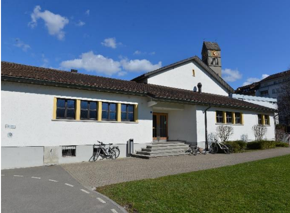
Eingang Turnhalle Letzi